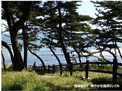
松林を歩く 興やかな海浜ドライブ

参加費 100円 日立市内に住んでいる方 先着20名 募集開始 10月12日(月) 午前9時 百年塾サロン 0294-23-9165