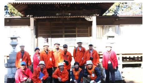
坂東市延命寺・平将門胴塚 (12/11)