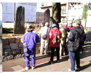
多賀市民フラガ前句碑