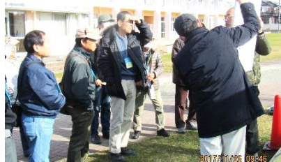
坂本小学校の校庭内古蹟 (11/26)