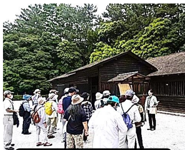
日立製作所創業小屋 (6/9)