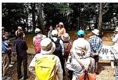
日立製作所1t原子爆弾投下跡 (6/9)