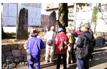
五世白兔園宗瑞・西行法師の碑 (11/17)