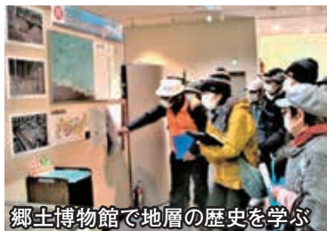
郷土博物館で地層の歴史を学ぶ