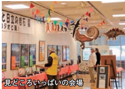
見どころいっぱい会場

学術的にも素晴らしく誇りに思う」「見学者同士で感心しながら仲良くなれた」「石は語らないけれど素敵な夢を見たような気持ち」「ワクワクした展示」など感動の声と、「郷土博物館でも展示して」との要望が寄せられました。