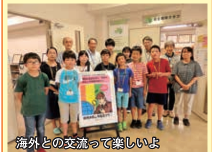
海外との交流って楽しいよ