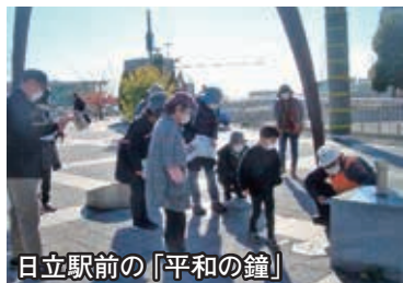
日立駅前の「平和の鐘」

先輩案内人を講師とした現地研修では、日立駅やかみね公園を起点に日立市の歴史や観光資源などについて学びました。日立の魅力を人々に語れるような多くの仲間が増えることを願っています。