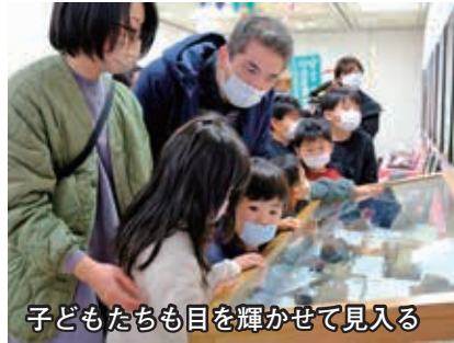
子どもたちも目を輝かせて見入る

で採取した水晶の粒を探すなど盛りだくさんの内容で大人気でした。来場者からは、「日立の地層が