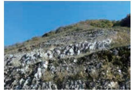
石炭紀 (諏訪町 大平田)