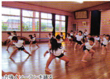
力強くソーランを踊る

衣装のはっぴはすべて保護者全員の協力による手作りで、大漁旗は久慈地区から贈られました。園では