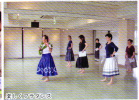
楽しくフラダンス