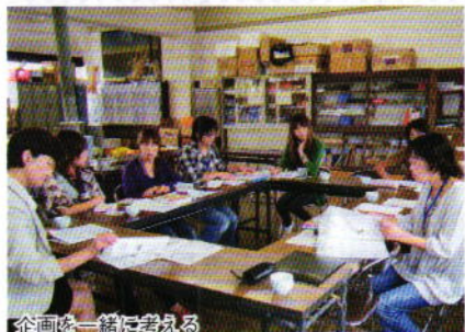
企画を一緒に考える

校PTAを対象に広報セミナーを開催し、初めて広報紙の編集にかかわる人たちのための講座を開催しています。たくさんのPTA広報委員が