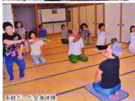
系統だった全身体操