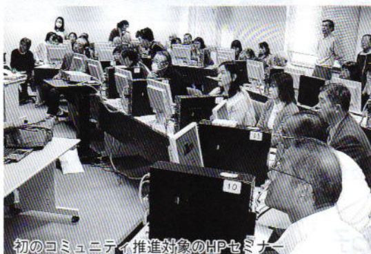
初のコミュニティ推進対象のHPセミナー