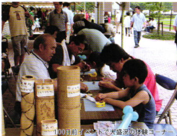
100日前イベントで大盛況の体験コーナー

百年塾本来の“学ぶこと”を大切に、学び舎である「日立のまち」について市民、行政、企業などすべての領域の人たちが一堂に集い考える機会を提供しようと、現在、部会を中心に準備の真っ最中です。