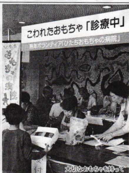
大切なおもちゃを持って