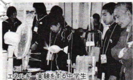
エネルギー実験をする中学生

百年塾協賛金にご協力を！（個人 一口1,000円以上、団体 一口10,000円以上）