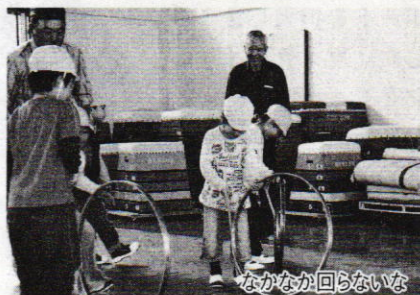
なかなか回らないな

校内には、チャレンジコース、おぼけ屋敷迷路、地底探検、昔あそびなど16のコーナーが設けられています。グラウンドでの開会式後、綱引きで汗を流した子どもたちは、各コーナーを巡ります。初めての体験も多く、さまざまな発見をしたようです。ウォークラリーでは、関所で出題された難問にチャレンジ、おぼけ屋敷には長い行列ができました。また、竹