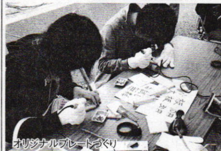
オリジナルブレッドづくり