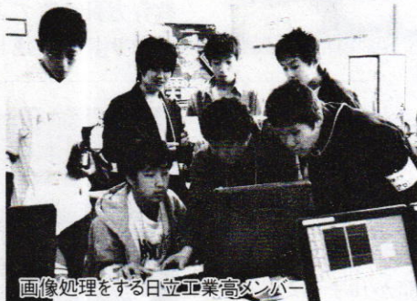
画像処理をする日立工業高メンバー