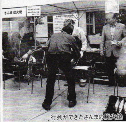
行列ができたさんまの炭火焼