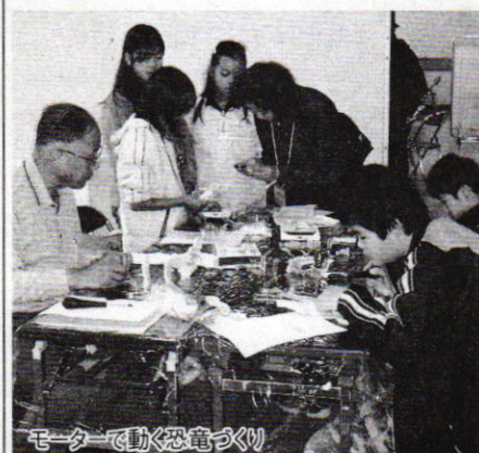
モーターで動く恐竜づくり