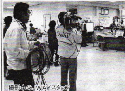
撮影中のJWAYスタッフ