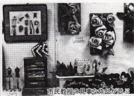
市民教授の見事な作品が並ぶ