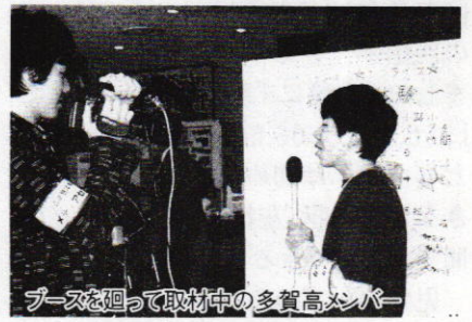
ブースを廻って取材中の多賀高メンバー

担当したブースはエネルギー実験と紙飛行機づくり、動きの小さいものは難しい、動きのあるブースも撮影してみたかった」と放送委員会の