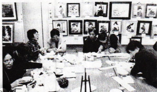
盛況!押し絵の体験コーナー 私たちが楽しかったよ