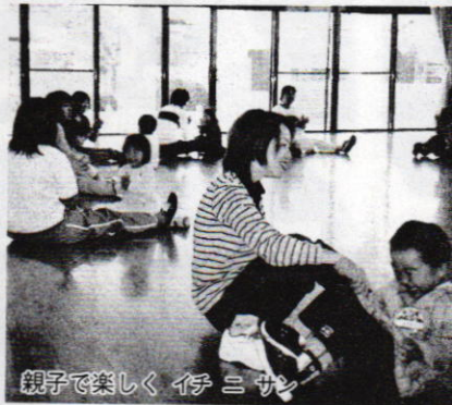
親子で楽しくイチャニサン

市内には11の公民館がありますが、それぞれの地域の環境を生かした事業が生まれ、市民の生涯学習の拠点の一つとして、多様な学習の機会を提供しています。今回は中央公民館的役割の2つの公民館を紹介します。