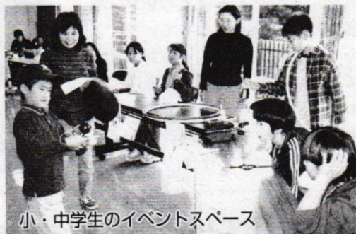
小・中学生のイベントスペース