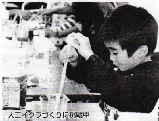
人工イクラづくりに挑戦中

今年の百年塾フェスタは各種団体や機関との協働をテーマに、健康づくり推進課や商店街などとの連携で新しい百年塾の方向を探りました。