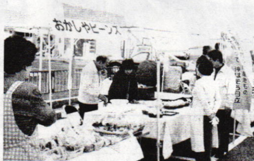
ザ・日立スペシャルに12店舗が参加