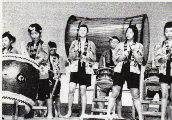
勇壮な音を響かせた諏訪太鼓