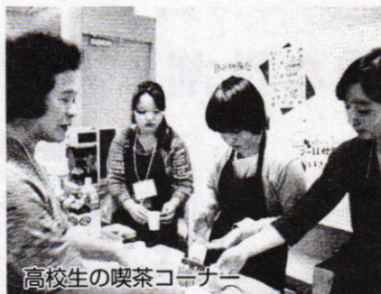
高校生の喫茶コーナー