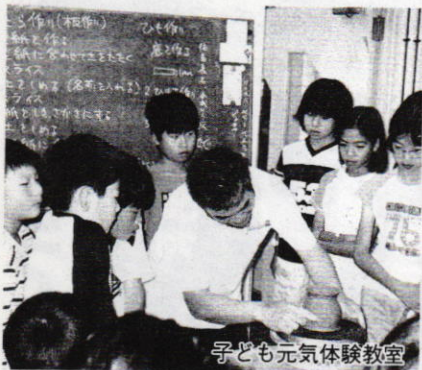
子ども元気体験教室

3階のロビーの一画に、公民館職員が持ち寄った自宅の庭の草花や小物などで、予算ゼロの季節感あふれるスポットが設けられ、訪れる人を「ほっと」させてくれています。