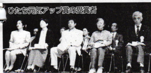
ひたち元気アップ賞の受賞者