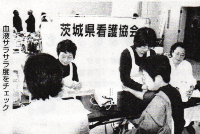
血液サラサラ度をチェック