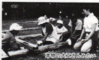
本物の大工さんみたい

この体験村には、県内13の市町村から32名の子どもたちが参加。海・山に恵まれた日立の自然の中で、親元を離