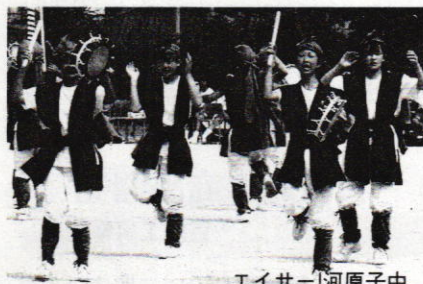
エイサー 河原子中