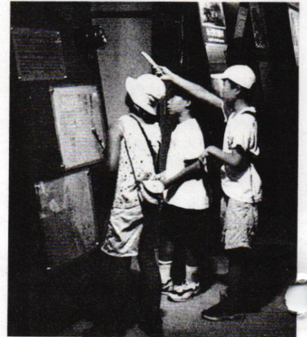
子どもたちも熱心に

多くの市民が、自分のまちの発展の歴史や生産活動の様子を知ることはまちを愛し物づくりへの思いを知る上で、重要なことです。百年塾の産業部会では、「こうしたツアーをこれからも続けたい。」と思っています。