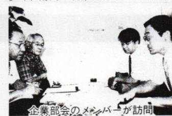
企業部会のメンバーが訪問

生涯学習は社会的にも関心が高まっており、講座の内容や市民教授の活用・登録など百年塾からの情報提供は好評のようです。社内報に百年塾の記事掲載を了承してくれる企業も多く、訪問の成果を上げています。