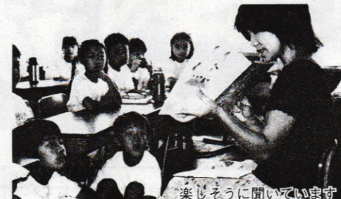
楽しそうに聞いています

スでお母さんたちに呼びかけて、子どもたちに絵本の読み聞かせをしています。絵本の周りに集まり楽しそうに聞いている子どもたちの姿と、一生懸命に絵本を読んでいるお母さん