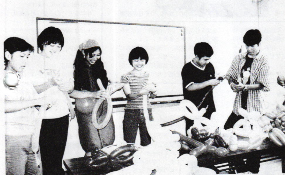
百年塾フェスタの「おもしろ講座」は、中学生スタッフが考えた楽しい企画がいっぱい。準備には高校生も加わり、販売するバルーンアートの作成やネイルアートの練習などに励んでいます。当日が楽しみ。

10月23日24日の2日間開催される百年塾フェスタ'99も間近となりました。フェスタには今年もたくさんの中학생や高校生がスタッフとして応募しています。これまでに各コーナーの企画会議などにも参加。いろいろなアイデアを出し合い、楽しいフェスタに向けての準備が着々と進められています。