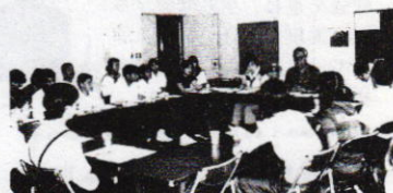
中学生の発想で企画中