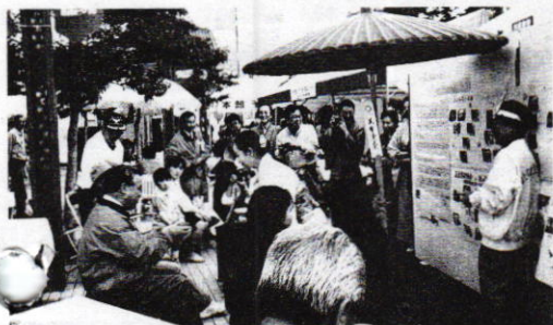
昨年の百年塾フェスタ風景

百年塾フェスタ'97が10月25日・26日の2日間行われます。「出あい」を合言葉に、人にやさしいまち、国際的なまち、市民と企業が共生するまち、学校が楽しいまち、若者が燃えるまち、楽しいまち、きれいなまち、の百年塾7つのテーマで工夫をこらした楽しい企画をしています。たくさんの中学生や高校生が企画・運営にあたり若いパワーがフェスタを盛り上げます。