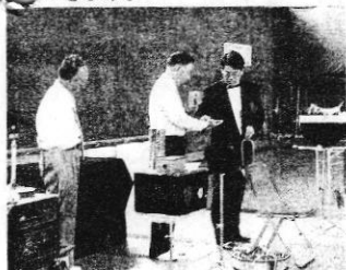
手さばきもあざやかに

勤めのかたわら、奇術に興味をもってもう20年になりました。楽しいマジックをモットーにしています。やり直しがきかないので緊張します。同じ場所では同じマジックをやらないように、場所と出しものを記録しておく必要があります。観客は何が起きるんだろうと期待しているの、新しいマジックをマスターしたり道具の購入も必要です。声が掛かれば幼稚園や小学校、老人会、福祉施設など、仲間とともにどこへでも出かきます。