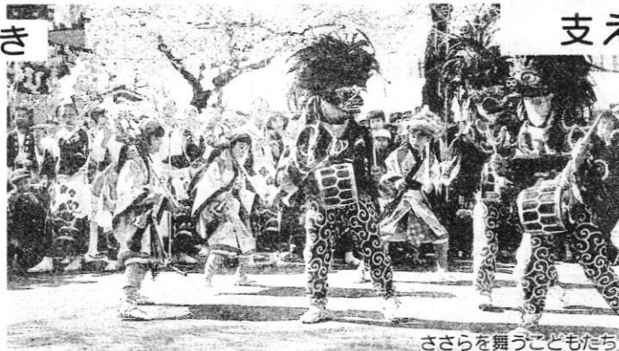
さらさらを舞う子どもたち