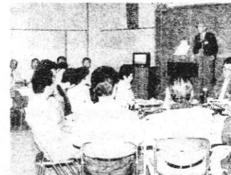
おやじ同士、仲良く(おやじ会)