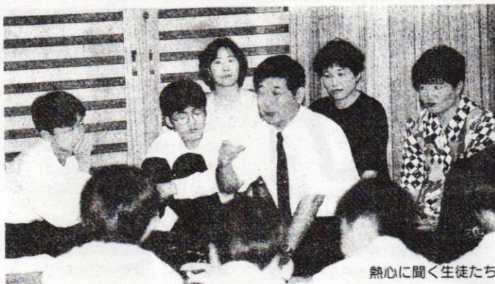
熱心に聞く生徒たち

日立市の中学校の中では体験学習を通して、さまざまな人と交流しながら、社会の一員としての自覚や責任を持たせる機会にと、職業体験学習を取り入れている学校があります。7月6日(土)、駒王中学校では、講師に卒業生のツアーコンダクター