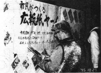
熱心に見ています。