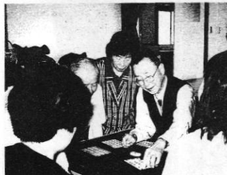
マーシャンを使った家庭ゲーム

市民が共に学んでいく場としてこの百年塾ゼミを大いに利用してほしいと思います。多くの参加者と市民教授のふれあいやつながりが持てたらと思います。