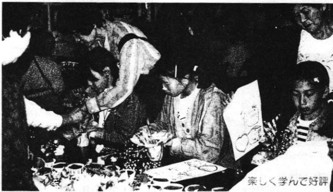
楽しく学んで好評

百年塾初の試みである、長時間討論会「フォーラムマラソン」が行われました。「国際的なまち」「人にやさしいまち」「楽しいまち」のテーマによる3部構成で、日立のまちについて考えていることを語り合いました。中学生からお年寄りまで、世代を越えて、ともに語り合うことの大切さと必要性を、改めて考えさせられました。