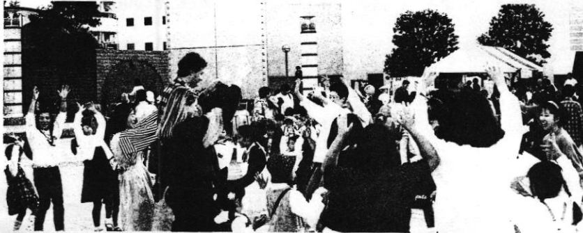
青空の下、いろいろな国の人たちと楽しい踊りの輪が広がって

10月28・29日の両日、百年塾フェスタ'95が開催されました。「ラブ&ピース」がテーマの今年は、市民教授の発表や企業、団体、行政の出展・展示とともに、28日は、国際交流ひろばや草の根国際交流ネットワーク「グラスネット」によるフォーラムなど国際色豊かに。そして29日は、みんなが語り合えるフォーラムマラソンや、設立20周年を迎えたコミュニティ推進協議会の模擬店や郷土芸能披露など、より多くの市民の参加によって、大きな盛り上がりを見せました。