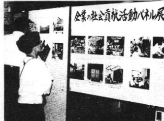
企業も一役、頑張ってます。