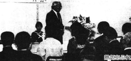
熱気あふれたフォーラム

百年塾の12の指定園・校が活動の様子をひまわりの花で紹介。見事に咲いた思い思いのひまわりに近寄って熱心にながめる人も。園旗・校旗の展示やビデオの上映も行われ、来場者にはひまわりの種のプレゼントもありました。