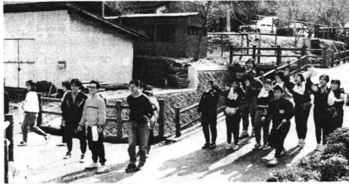
子供たちから大人気のYLCのおにいさんとおねえさん