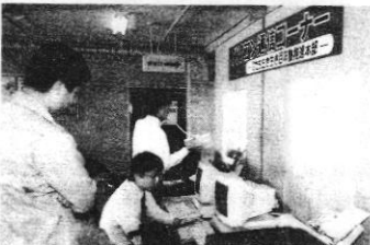
ワープロ (パソコン) 通信PRコーナー