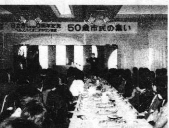
和気あいあいの50歳市民の集い